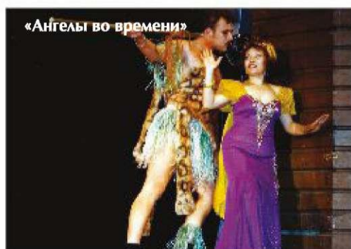
«Ангелы во времени»