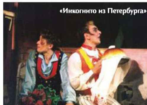
«Инкогнито из Петербурга»