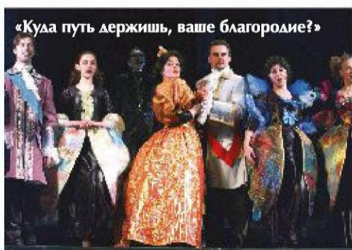
«Куда путь держишь, ваше благородие?»