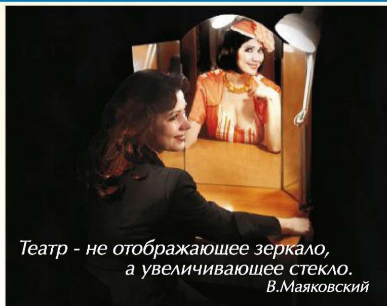
Театр - не отображающее зеркало, а увеличивающее стекло. В.Маяковский

Так, может быть, не стоит искать ответа на простой вопрос, а просто пойти в театр, увидеть и узнать театр новый, театр современный, театр многоликий и многообразный.