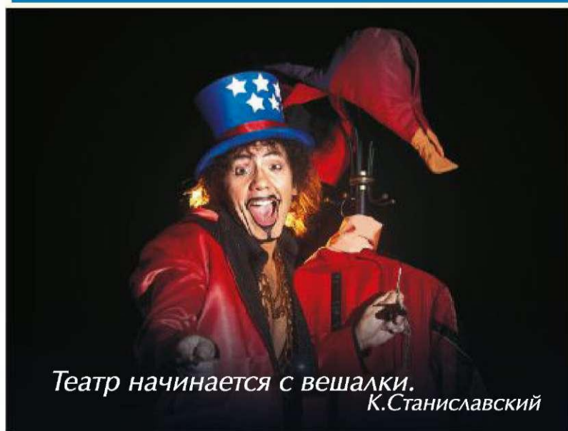
Театр начинается с вешалки. К.Станиславский